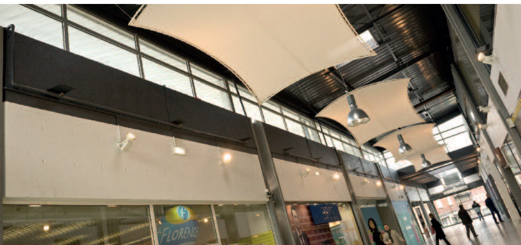
Les Halles, Amiens (80)