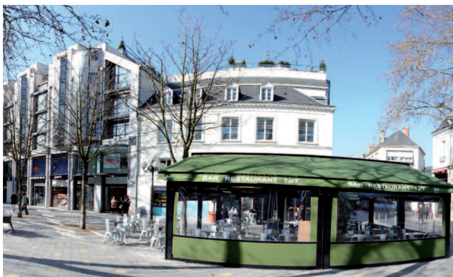
Galerie du Palais, place Jean-Jaurès, Tours (37)

J.B. : Les résultats du premier semestre de cette année seront publiés le 1 er août 2013. Ce sera notamment l'occasion de présenter le bilan consolidé du groupe MRM à l'issue de l'opération de recapitalisation.